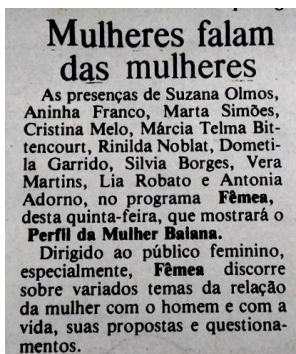
Figura 3: Recorte do jornal Tribuna da Bahia sobre o programa Fêmea