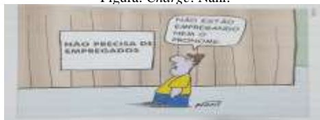
Figura: Charge : Nani.

Fonte: Ormundo e Siniscalchi (2018a, p. 181).