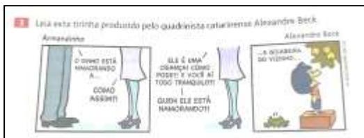
Figura 3: Tirinha: Armandinho.