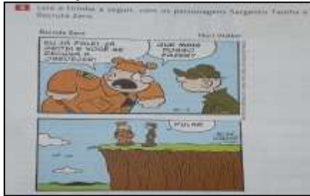
Figura 6: Tirinha: Recruta Zero.