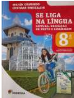
Figura 1: Capa do Livro Didático.

No primeiro aspecto de análise, trataremos da organização do referido livro didático. Na Figura 1, apresentamos a capa do livro didático do aluno Se Liga na Língua: leitura, produção de texto e linguagem , 8º ano, de Wilton Ormundo e Cristiane Siniscalchi (2018).