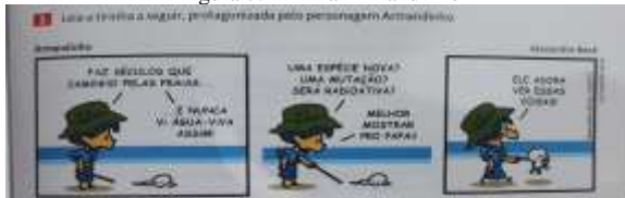
Figura 7: Tirinha Armandinho