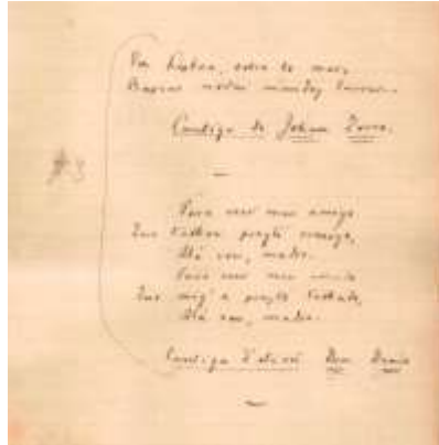
Figura 3: Folha s/nº das cantigas no manuscrito “Memorial de Aires”.

Observa-se na figura anterior que o sublinhado simples foi convertido em itálico, o sublinhado duplo em versalete e o pequeno traço separador ao final indicou encerramento da página tendo em vista o livro editado em 1908.