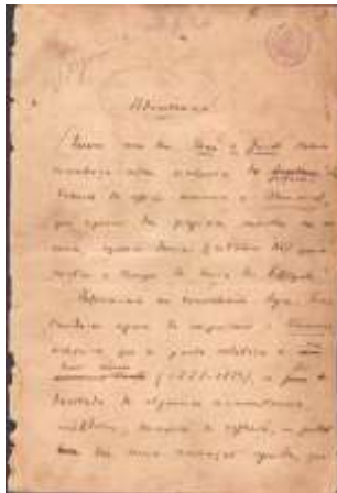
Figura 2: 1ª pág. da “Advertência” do manuscrito “Memorial de Aires”.

Os sublinhados simples, por exemplo, foram convertidos para o itálico na impressão do livro tipográfico, enquanto que o sublinhado duplo foi convertido em versalete, o que pode ser verificado desde as primeiras páginas do romance. Na figura a seguir podemos notar também o carimbo da ABL 521 e na parte superior da folha de papel almaço algumas anotações a lápis: