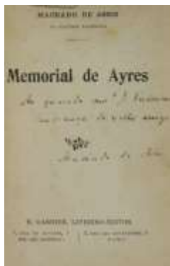
Figura 6: Folha de rosto da 1ª ed. de “Memorial de Ayres” (1908)

Desta maneira, na edição crítica elaborada pela Comissão Machado de Assis (1975; 1977) foi empregada a primeira edição pública de 1908 para o estabelecimento do texto crítico, cuja folha de rosto exemplificamos com a imagem abaixo: 529