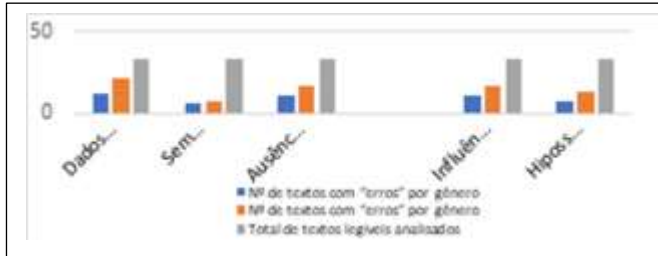
Gráfico 1: “Erros” de segmentação por gênero fem. e masc. (textos espontâneos).