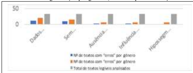
Gráfico 2: “Erros” de segmentação por gênero (reescrita após intervenção da docente).